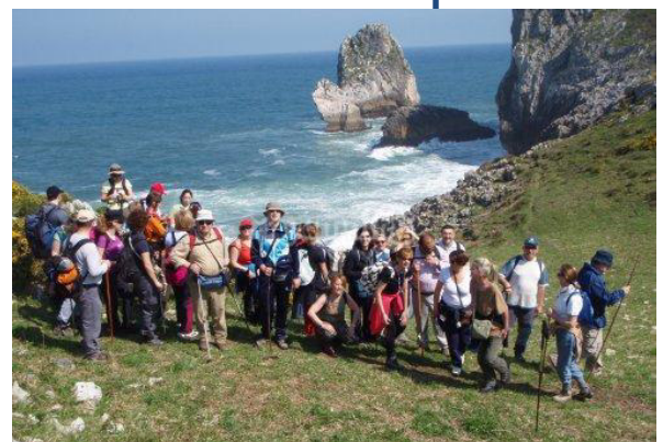
un grupo de senderismo