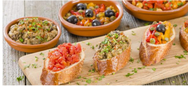
tapas – comida típica de España